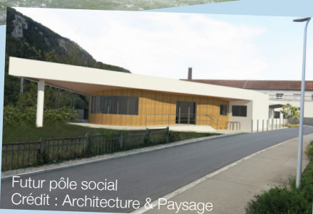
Futur pôle social Crédit : Architecture & Paysage